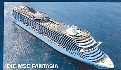
DIE MSC FANTASIA

Es gelten die Allgemeinen Reisebedingungen (ARB 1992) in der letztgültigen Fassung. Reiseveranstalter: ACR-Reisen, 9020 Klagenfurt, Primoschgasse 3. Eingetragen im Veranstalterregister beim BMfWA unter der Nummer 2013/12, abgesichert durch Zürich Insurance Europa AG, Platz der Einheit 2, 60327 Frankfurt, Kaera Aktiengesellschaft, Gewerbepark Süd 25, 6068 Mils.