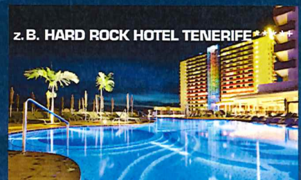
z. B. HARD ROCK HOTEL TENERIFFA *****

Die MSC Fantasia vereint Stil und Ökologie, indem sie die Wärme und den Komfort einer mediterranen Atmosphäre mit modernem Design kombiniert. In ihrem Herzen finden Sie eine echte, aus Stein erbaute Piazza, wo sogar eine Espresso-Bar zu finden ist, die frische Backwaren und echtes Gelato serviert – der perfekte Ort, um sich von der Schnäppchenjagd in den Boutiquen und dem nahegelegenen Duty-Free-Geschäft zu erholen. Genießen Sie die weltstädtische Atmosphäre unserer Themenbars. Hier gibt es Gourmet-Spezialitäten und ein wechselndes Entertainment, eine Pianobar, eine Jazzbar. Den ultimativen Luxus bietet unser exklusiver MSC Yacht Club. Das einzigartige Schiff-im-Schiff verfügt über eine eigene Rezeption, einen 24-Stunden Butler-Service, eine private Lounge und ein Pool-Deck.